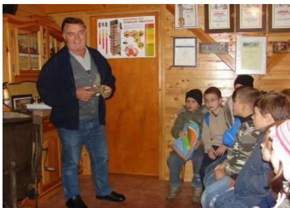
Slike 22-24. Obisk domačega čebelarja