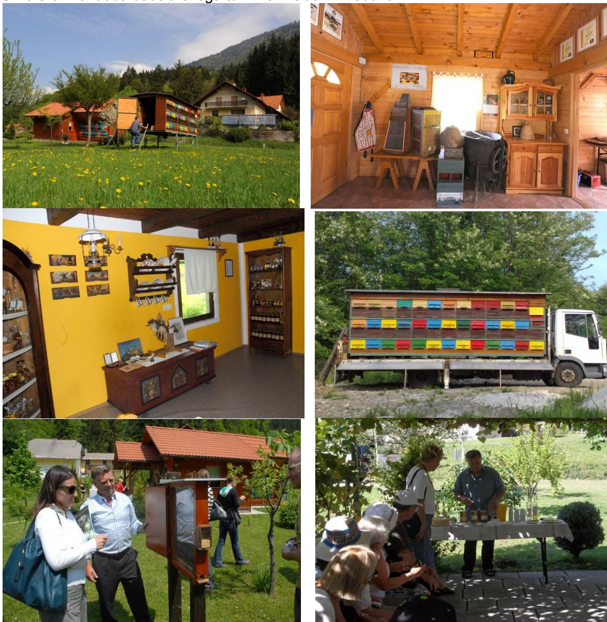
Slike 3-9: Ponudba čebelarskega turizma v Občini Preddvor

Čebelarsko društvo se redno prijavlja na javne razpise občine Preddvor za sofinanciranje dejavnosti društev, kjer se jim dodelijo sredstva za redno dejavnost, sofinanciranje praznika ob Čebelarski lipi ter izdatno pomočjo Občine pri izdaji biltena ob 110-letnici ČD Fran Lakmayer Preddvor.