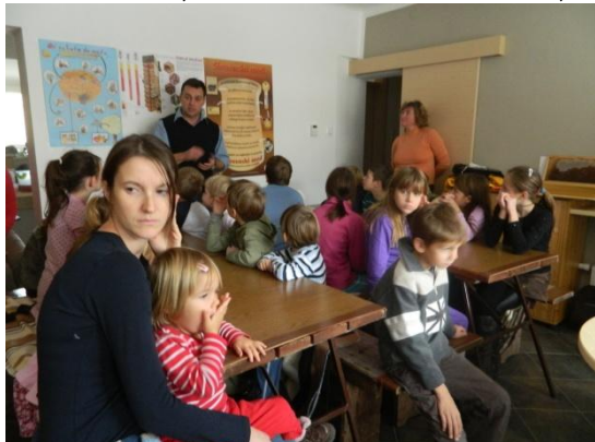
Slike 25 - 32, delavnice v TIC Preddvor, december 2011

V TIC Preddvor sta bili lani z namenom popularizacije čebelarjenja, skrbi za naravo in izobraževanja najmlajših izvedeni 2 delavnici na to temo. Udeležba je bila odlična in v prvem delu so otroci spoznali življenje in delo čebel ter potrebo po varovanju okolja in čebel. V drugem delu pa so spoznali čebelje izdelke in izdelovali novoletne okraske in svečke iz čebeljega voska.