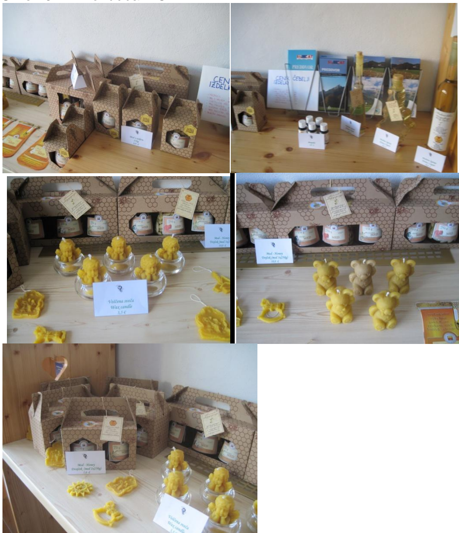
Slike 13-17: Ponudba TIC

Na turizmu si boste v lepo urejenem čebelnjaku z okolico ogledali panje, čebelarско orodje, api komoro z ležišči, čebelarски muzej, kontejner ter veliko medonosnih rastlin. V opazovalnem panju boste lahko opazovali čebeljo družino pri vsakodnevnih opravilih, ter izdelali še marsikaj zanimivega. Na koncu obiska pa boste vse čebelje pridelke, od medu, propolisa, cvetnega prahu, medenega peciva do medenega likerja, ki si jih obiskovalci lahko tudi kupijo.