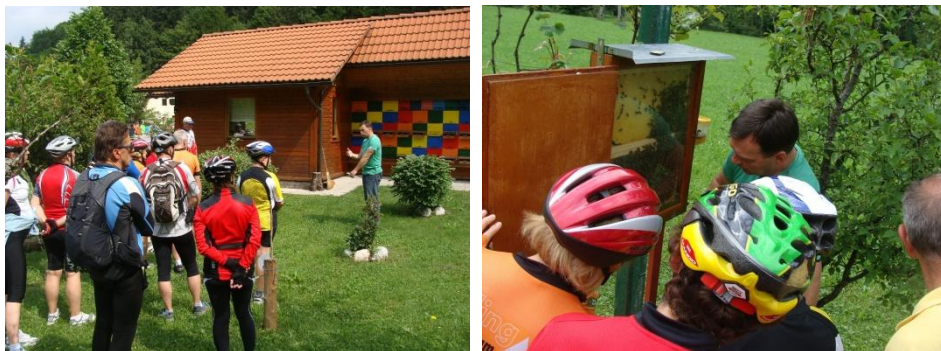
Slike 10 -12: Obisk skupine kolesarjev

TIC Preddvor je junija letos organiziral tudi kolesarsko prireditev in vsi udeleženci so obiskali tudi Čebelarstvo Koki, kjer so si lahko ogledali panje, čebelarstvo orodje, api komoro z ležišči, čebelarji muzej, kontejner ter veliko medonosnih rastlin. V opazovalnem panju so lahko opazovali čebeljo družino pri vsakodnevnih opravilih, ter izvedeli še marsikaj zanimivega. Na koncu obiska pa so poizkusili vse čebelje pridelke, od medu, propolisa, cvetnega prahu, medenega peciva do medenega likerja, ki so jih lahko tudi kupili.